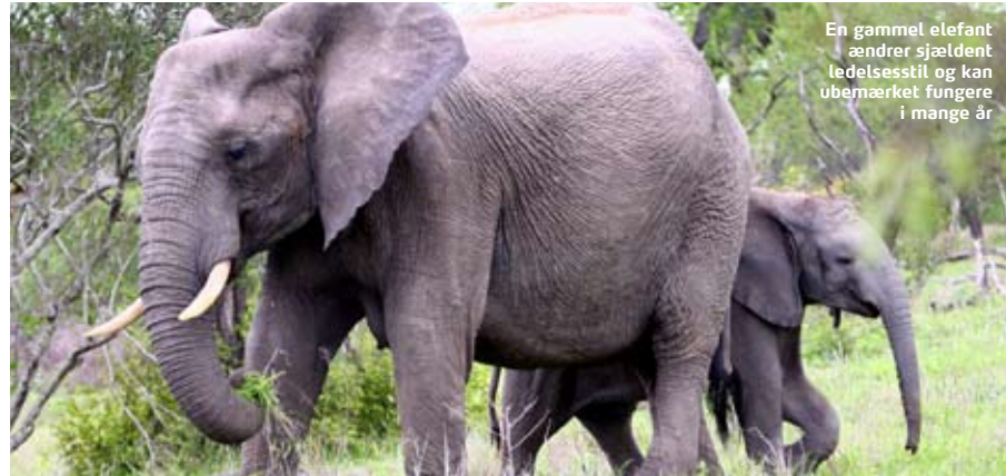
En gammel elefant ændrer sjældent ledelsesstil og kan ubemærket fungere i mange år