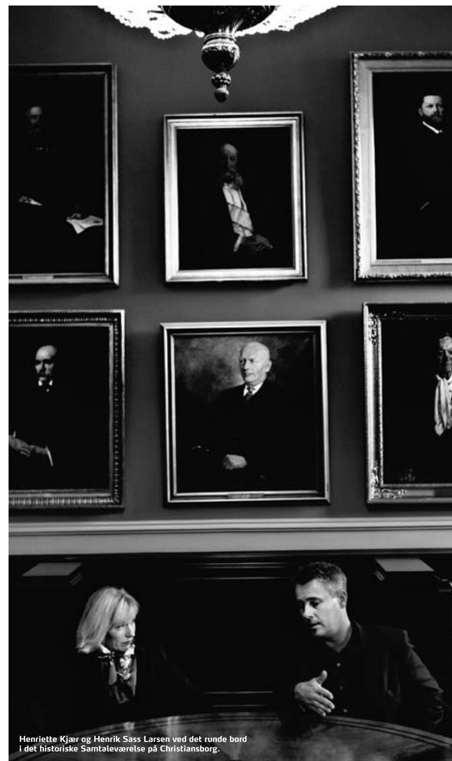
Henriette Kjær og Henrik Sass Larsen ved det runde bord i det historiske Samtaleværelse på Christiansborg.

”Vi foreslår at give en brutto fremgang på 5000 kroner til folkepensionisterne om året - og det finansierer vi delvist ved at indføre millionærskat. Men det er jo en klassisk fordelingsdiskussion. Det er ikke underligt at socialdemokraterne ligger her - og det er heller ikke underligt, at Konservative mener