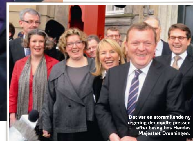
Det var en storsmilende ny regering der mødte pressen efter besøg hos Hendes Majestæt Dronningen.

Videnskabsminister: Charlotte Sahl-Madsen