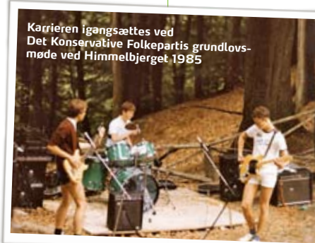
Karrieren igangsættes ved Det Konservative Folkepartis grundlovs-møde ved Himmelbjerget 1985