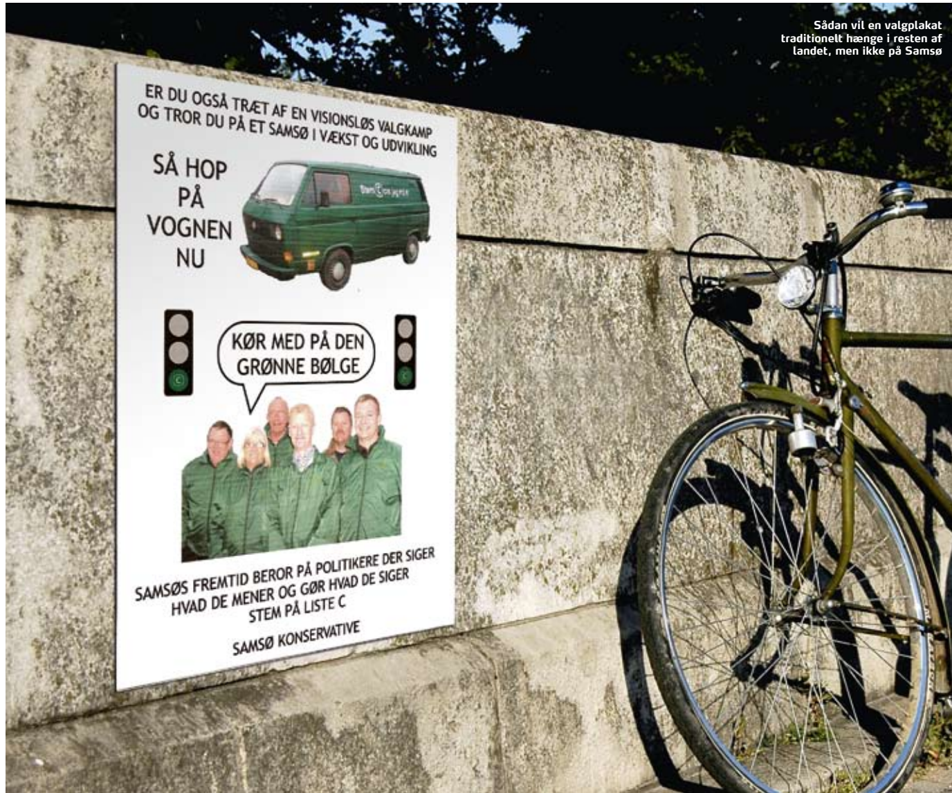
Sådan vil en valgplakat traditionelt hænge i resten af landet, men ikke på Samsø